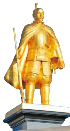
黄金の織田信長公像